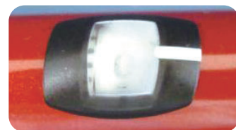
③ ダイアル表示窓の曇り