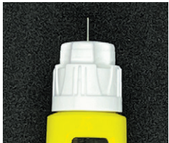
まっすぐ取り付けた状態