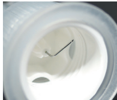
後針の折れ曲がり