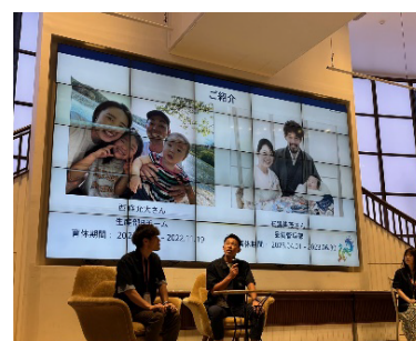
男性育児休暇取得のイベントを開催