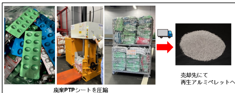
PTPシートを圧縮して マテリアルリサイクル化を実現