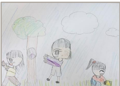
「たからさがし」、山梨県、8歳