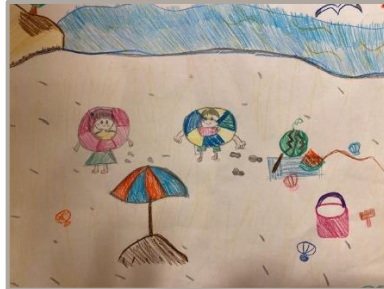
「サマーキャンプ」、和歌山県、10 歳