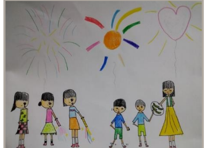
「楽しい花火」、大阪府、10歳