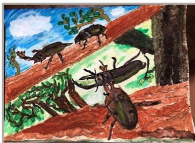
「カブトムシとクワガタムシのたたかい」 鹿児島県、8歳