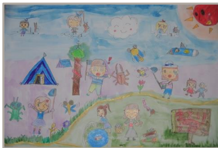
「何がおこるか分からない！ワクワク ドキドキ 虫とりキャンプ！」、新潟県、7 歳