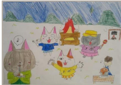
「にゃんこキャンプファイヤー」 群馬県、8歳