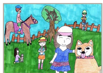
「お友だちと動物と仲良くなれるキャンプ！」 群馬県、9 歳