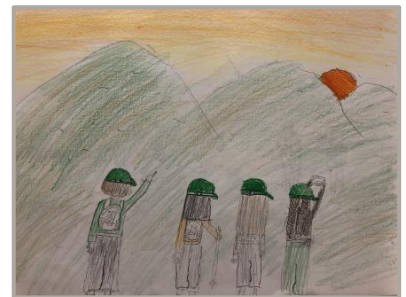
「みんなで登山、夕日を見よう！」 新潟県、10 歳