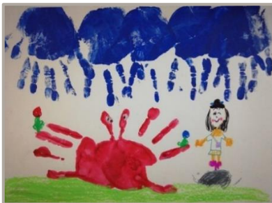
「雨降りにカニとり」、大阪府、9 歳