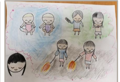
「憧れのサマーキャンプ」、大阪府、7歳