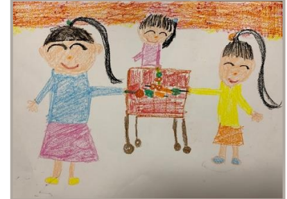
「楽しいバーベキュー」、茨城県、9歳