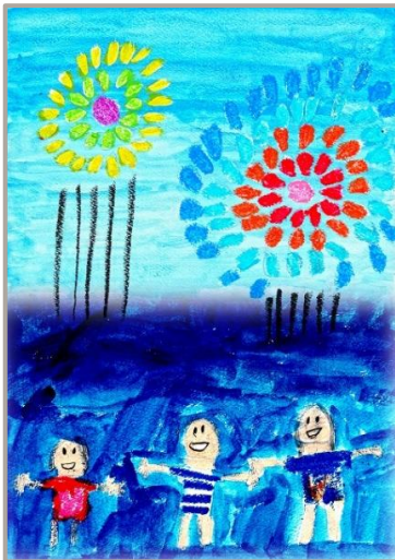
「やってみたいな花火大会」 神奈川県、7 歳