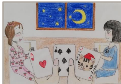
「夜更かし」、兵庫県、11歳