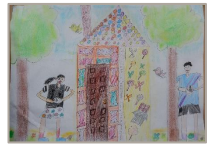
「みんなでおなかいっぱい食べたいなあ」 群馬県、8歳