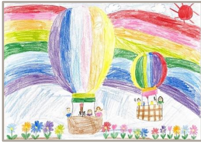
「気きゆうにのりたいな」、京都府、8歳