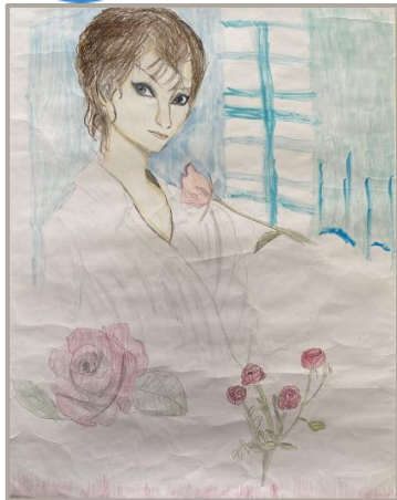
「ポーの一族」、兵庫県、10 歳