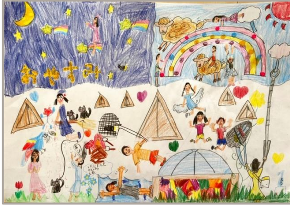
「1 日中楽しめるアスレチックキャンプ」、神奈川県、7 歳