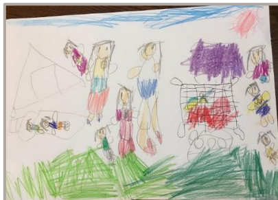
「サマーキャンプに行きたい」 兵庫県、6 歳