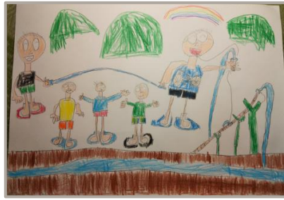
「みんなでなわとびたのしいな そうめんながしもたのしいよ」 佐賀県、6歳