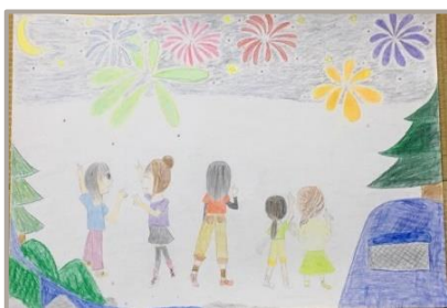
「打ち上げ花火」、大阪府、10歳