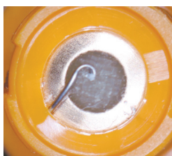
折れた後針が刺さっている