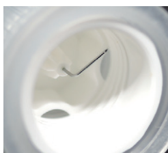
後針の折れ曲がり