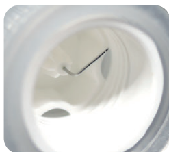
後針の折れ曲がり