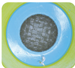
金属キャップの傷