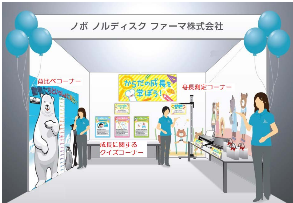
丸の内キッズジャンボリー2017の当社ブース「からだの成長を学ぼう！」のイメージ図

ブース内では看護師がお子さんの身長を測定し、パソコンを用いて成長曲線への記録と印刷を無料で行うコーナーを設け、ご家庭でも継続して成長曲線に記録していただけるように呼びかけます。