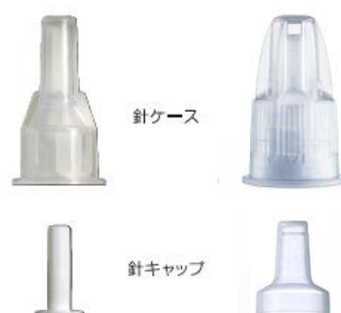
(左: ペンニードル®32G テーパー、右: 新しい注射針、ペンニードル®プラス)

ノボ ノルディスクは、針刺し事故のリスクを最小化するため、針キャップや針ケースのデザインに人間工学を応用し、大きく取り扱いやすい形状にすることで、患者さんが注射針の着脱を安全かつ容易に行えるようになりました。